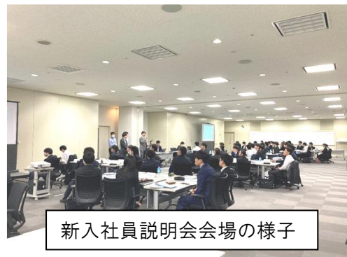
新入社員説明会会場の様子

4月3日(水)クロスウエーブ府中にて、新入社員64名を対象とした組合説明会を実施しました。新入社員研修は人事(会社側)にて設定しているものですが、会社との関係が良好なことから、ありがたいことに毎年説明の場を設けて頂いております。