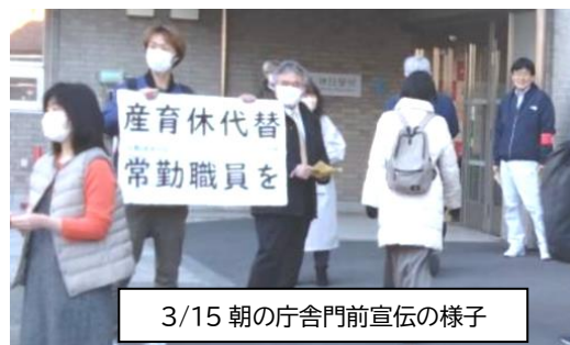
3/15朝の庁舎門前宣伝の様子

でも、常勤職員を何人増やすのかはまだ決まっていません。調整中となっています。来年度は民営化で浮いた人員を過員配置し、