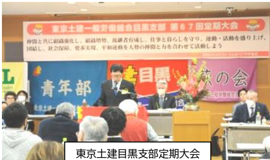
東京土建目黒支部定期大会