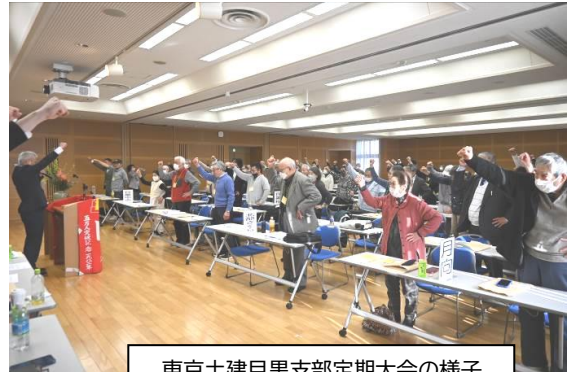
東京土建目黒支部定期大会の様子