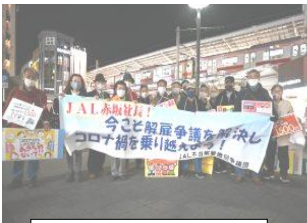
自由が丘駅前：18名参加