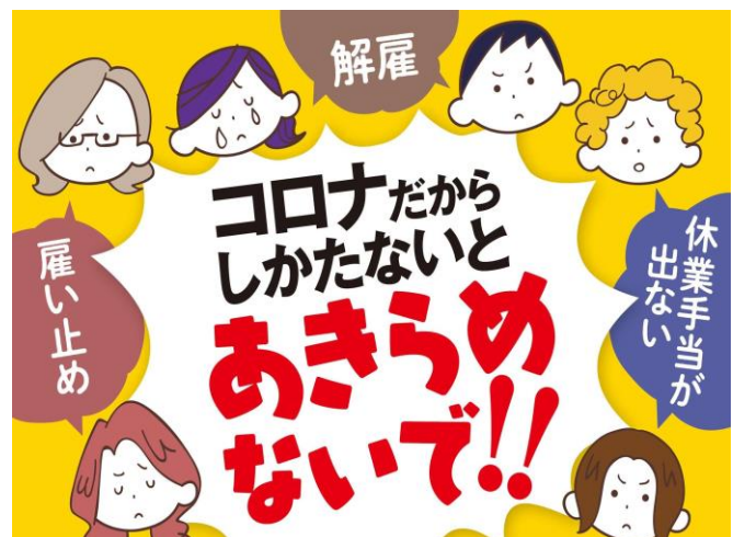
「パネル」も多数つくりました